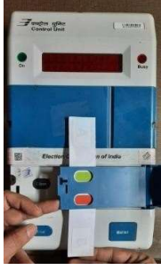
ग्रीन पेपर सील को लगाना