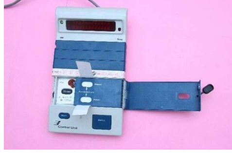
स्पेशल टैग के साथ परिणाम अनुभाग के आंतरिक कवर को सील करना