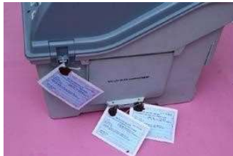
एड्रेस टैग के साथ वीवीपैट के ड्रॉप बॉक्स को सील करना