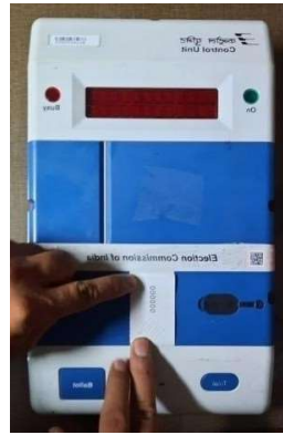
ग्रीन पेपर सील लगाना